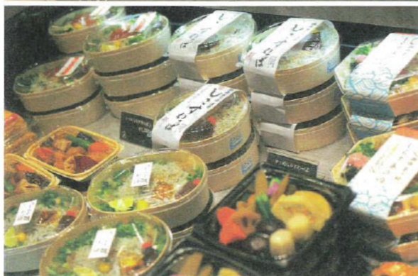
同社が最初に手がけたM&A、湘南茅ヶ崎の老舗仕出し弁当屋「ちがさき濱田屋」(株式会社浜田屋)