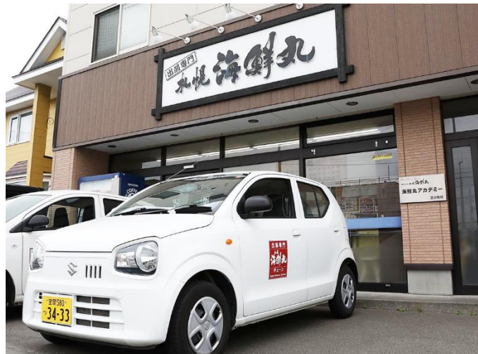
<参考画像：海鮮丸店舗外観>