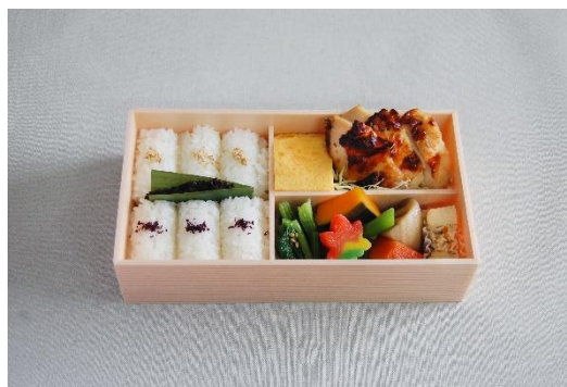
塩麹鶏幕ノ内弁当